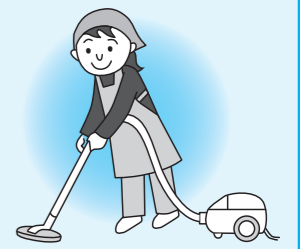
寝室や居間など普段使われている部屋などの掃除