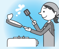
調理・買い物など