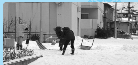
昨年の活動の様子

登録・お問い合わせは 東区ボランティアセンターまで 電話:025-272-7731