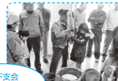
東山の下支会 歳末もちつき大会