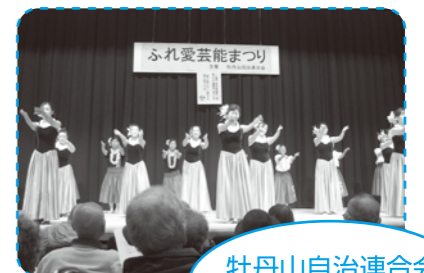
牡丹山自治連合会 ふれあい芸能祭り