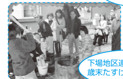
下場地区連合自治会 歳末たすけあい世代交流